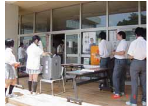
上:コース「模擬」総選挙2003 @芝浦工大柏中学高校