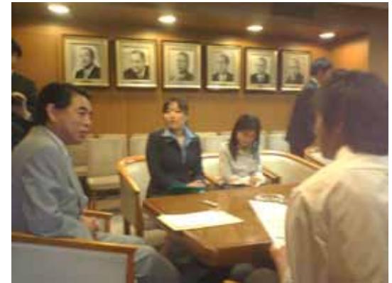
政党本部探検ツアー(参院選04)@自民党本部