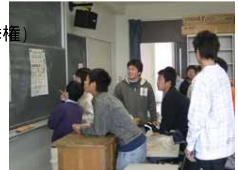
選挙公報を見る高校生(03年東京都知事選挙)