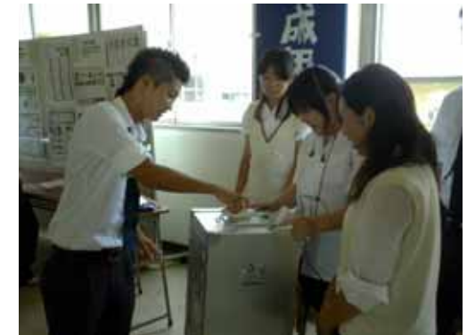
本物の投票箱に投票する高校生