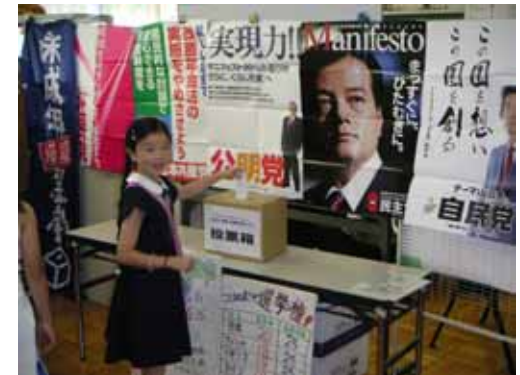
投票する小学生(04参院選)

若者の低投票率は政治不信の現れで民主主義を形骸化させます。模擬選挙で現実の選挙の重要性を知れば、若年層の投票率向上に役立ちます。家庭や地域で若者が選挙について話をするすることで、家庭や地域でも投票率を上げる効果が期待できます。