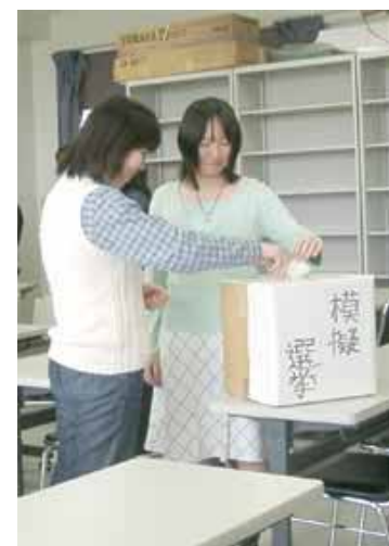
ユース“模擬”総選挙2003