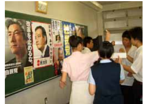
未成年「模擬」総選挙2005 @玉川学園高等部